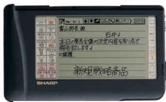
シャープ「ザウルス」

なーんだ、それってスマホじゃないの？と思った方、正解です。今でこそ、当たり前のように皆さんが使っているスマホですが、今から 20 年ほど前には、その先駆けとも言えるエポックメイキングな製品が続々開発されていたのです。私自